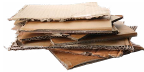
Bìa các tông phẳng