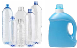
Chai và can nhựa