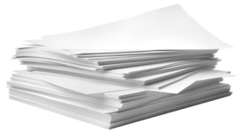
Giấy, Báo & Tạp chí