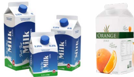
Hộp giấy (các tông)