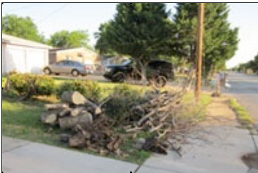
Tamaño elegible para recogida gratuita